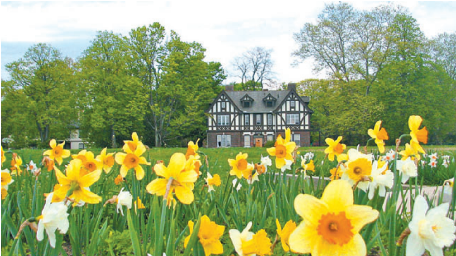
Villa de los niños, donde son llevados los infantes que pasan por un proceso legal antes de ser entregados a sus padres y después de ser detenidos por migración.