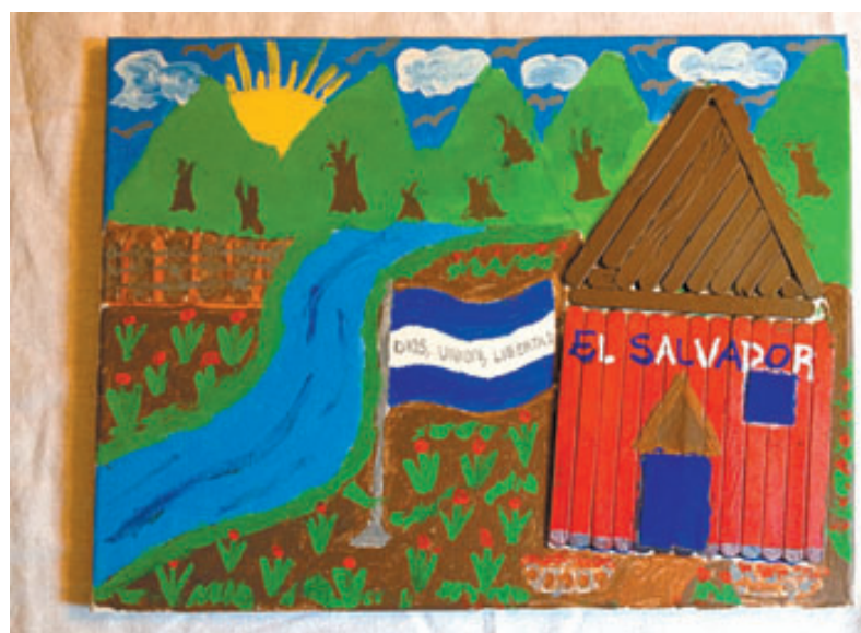
Los niños migrantes realizan estos dibujos como parte de su terapia. Las imágenes fueron hechas por salvadoreños.